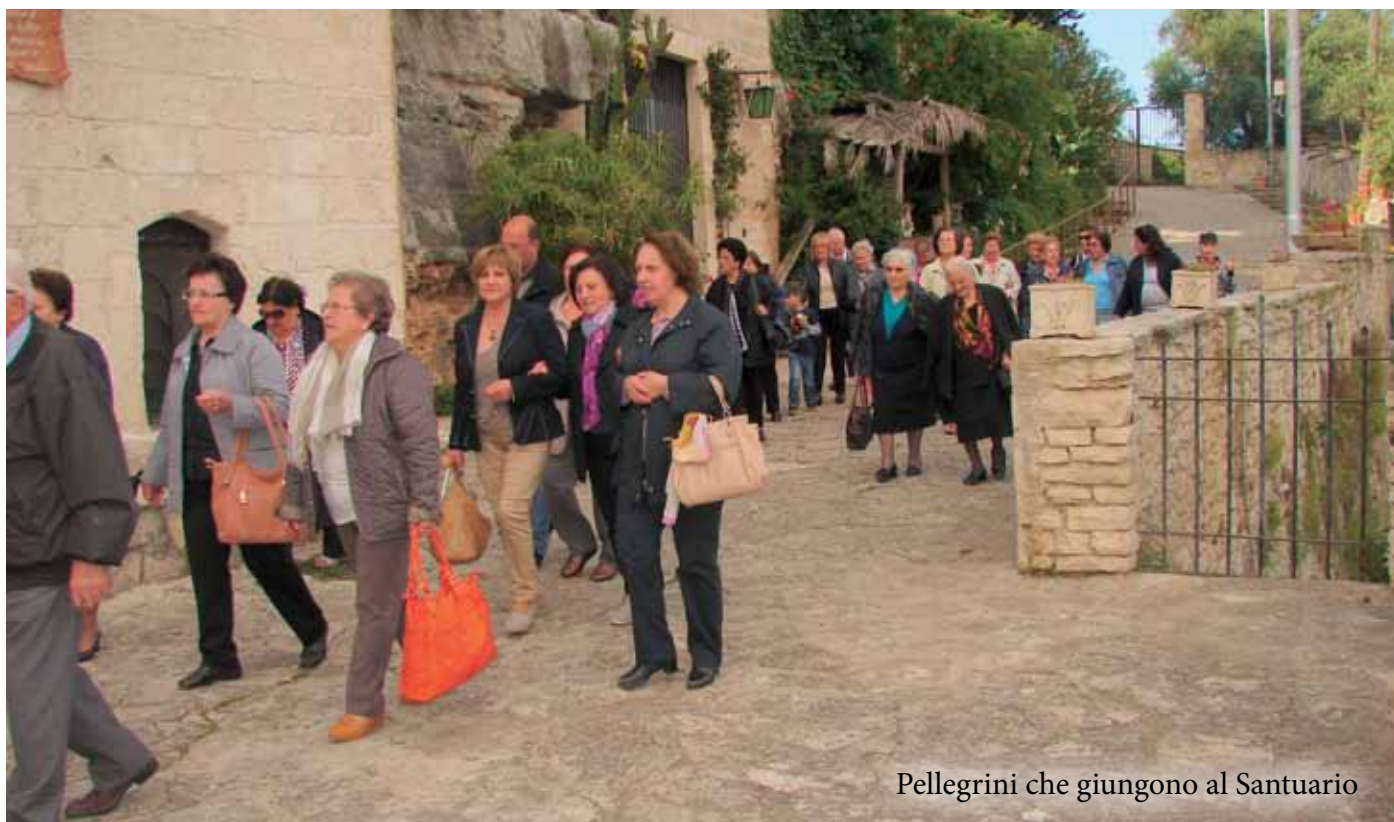
Pellegrini che giungono al Santuario

N el presente numero l'attenzione si ferma sulla funzione del Santuario e del suo valore spirituale.